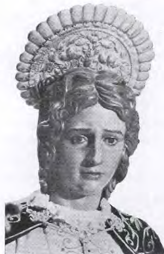
VIERNES SANTO (SANTO ENTIERRO)

De nuevo, San Juan, esta vez en el cortejo del Santo Entierro: “El discípulo es como agua de mar, cuajada en transparencias y reflejos de la divinidad. ¡Qué lejos su barca muerta al sol, crujiente de sed!”.