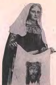
VIERNES SANTO (PROCESIÓN DEL ENCUENTRO)

Ilustración de la revista “Semana Santa Cartagena 1945”