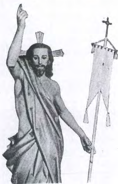
DOMINGO DE RESURRECCIÓN

por Francisco José Ródenas Rozas , Cronista Oficial de La Unión