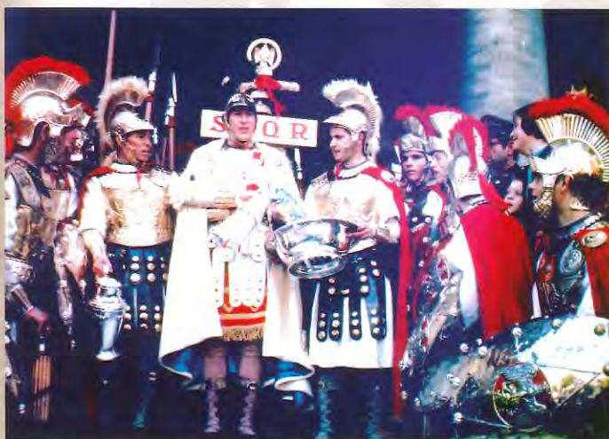
Lavatorio de Pilatos (Cartagena)

La Semana Santa de La Unión ha sido siempre, a lo largo de los períodos de esplendor que ha vivido en el transcurso de su dilatada historia, un reflejo de las procesiones que se celebraban en Cartagena, imitando algunas de las características de éstas e incorporando incluso a su patrimonio elementos materiales que los cofrades cartageneros eliminaban de sus cortejos. Pero también, en ocasiones, lo que hicieron los procesionistas de la vecina localidad minera fue adoptar como propios elementos del patrimonio inmaterial de las hermandades cartageneras, tales como músicas o actos.