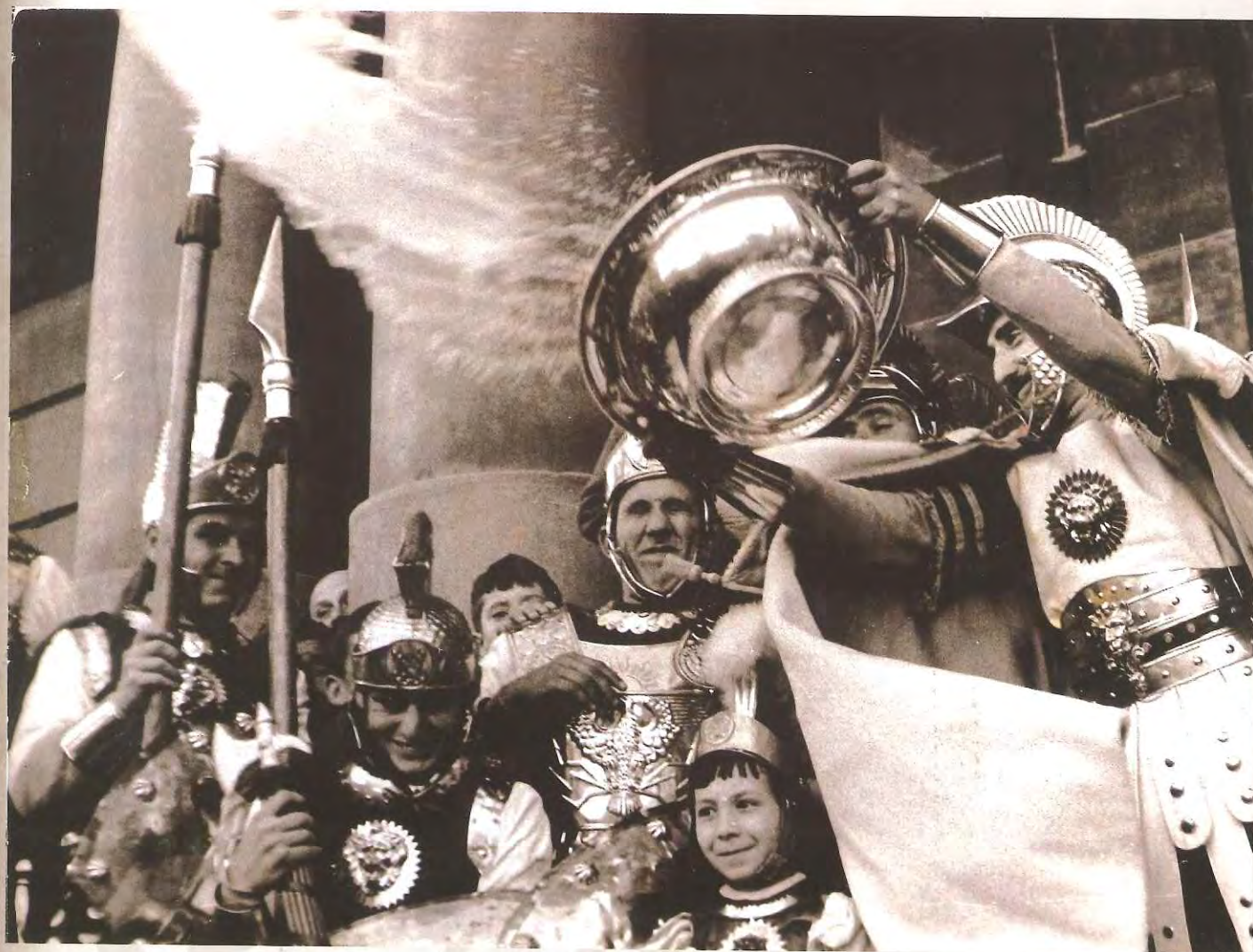
Lavatorio de Pilatos (Cartagena)

fondos con los que sufragar los cuantiosos gastos de organización de los desfiles, los cofrades unionenses los celebraron, que hayamos podido constatar en las hemerotecas regionales, en los años 1926 y 1927. 3 Quizás en este caso era un intento, casi a la desesperada, de intentar mantener la salida de las procesiones que de nuevo, como había ocurrido a finales del siglo XIX, entraban en crisis. De hecho, el segundo de los años citados fue el que supuso el fin de la segunda etapa de esplendor de los cortejos pasionarios de La Unión.